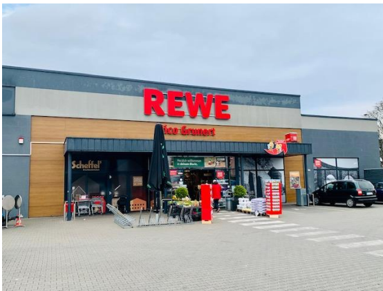
Abbildung 4: Rewe-Supermarkt in der Andernacher Innenstadt (Foto)

Mit einem modernen Rewe-Supermarkt (ca. 1.600 m 2 VKF) an der Breite Straße ist in der Andernacher Innenstadt lediglich ein Lebensmittelmarkt ansässig. Die Lebensmittelversorgung wird durch kleinflächige Anbieter (u.a. Roni Markt, Jousef Market, Reformhaus, Obstparadies Duran, Weingalerie) und Anbieter des Lebensmittelhandwerks (u.a. Bäckerei Hoefler, Bäckerei Rommersbach, Fleischerei Ahsenmacher) ergänzt.