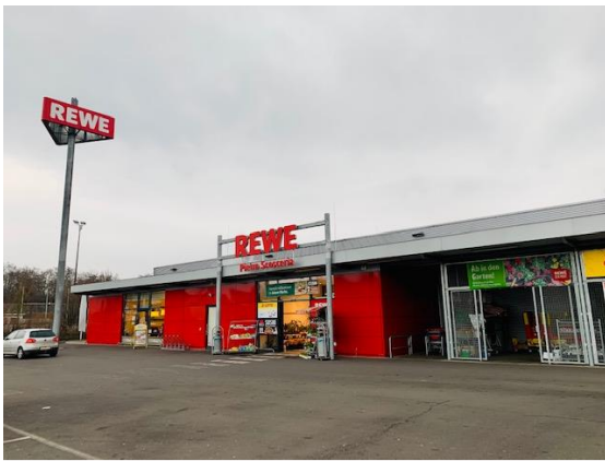
Abbildung 8: Rewe an der L 117/ Friedhofstraße (Foto)

Der Rewe-Supermarkt ist im westlichen Teil der Ortsgemeinde Plaidt in unmittelbarer Nachbarschaft zum Rathaus der VG Pellenz im zentralen Versorgungsbereich an der L 117 / Friedhofstraße verortet.