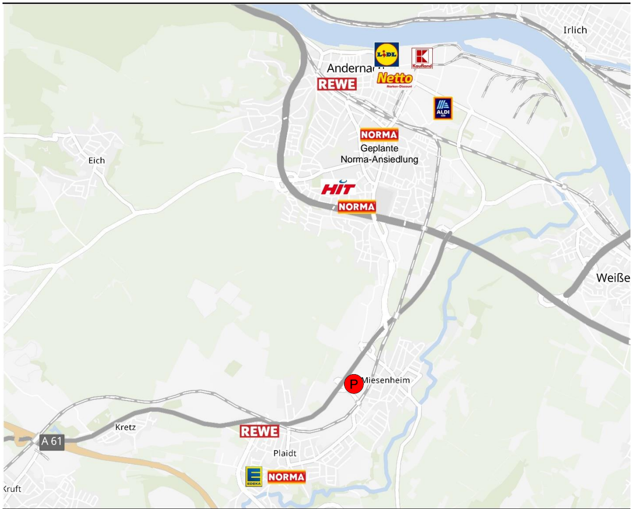
Abbildung 2: Wettbewerbssituation