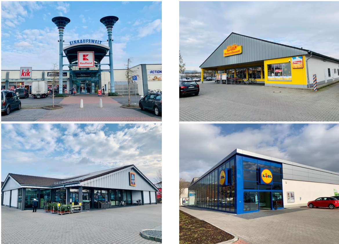
Abbildung 5: Projektrelevante Lebensmittelmärkte im Standortbereich Koblenzer Straße / Füllscheuerweg (Fotos)