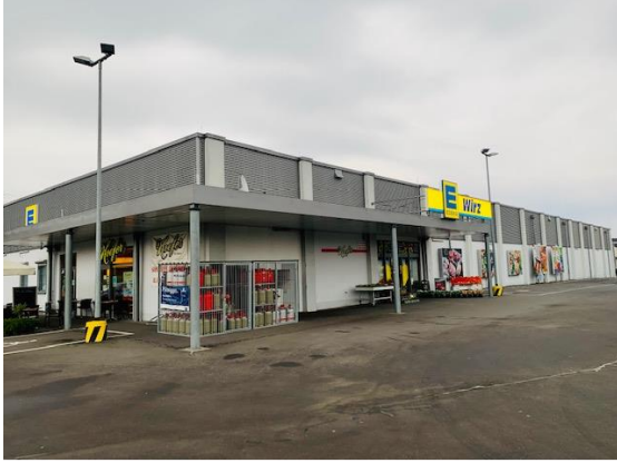
Abbildung 7: Projektrelevante Lebensmittelmärkte an der Fraukircher Straße in Plaidt (Fotos)

der Standort insbesondere zur Versorgung der im südlichen Bereich der Verbandsgemeinde und in Andernach-Miesenheim lebenden Wohnbevölkerung bei.