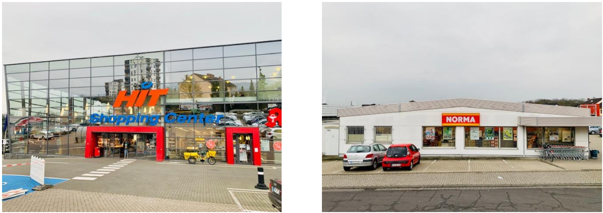
Abbildung 6: Sonstige projektrelevante Lebensmittelmärkte in der Stadt Andernach (Fotos)