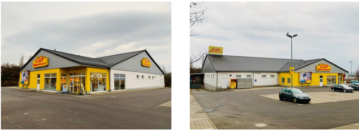
Abbildung 1: Fotos des Planstandortes

Neben der Analyse des Makrostandortes stellt die Mikrostandortanalyse den zweiten Teil der Standortbewertung dar. Damit werden insbesondere die Aspekte der Lage und der verkehrlichen Erreichbarkeit thematisiert. Der Mikrostandort ist vor allem auch für die Abgrenzung des prospektiven Einzugsgebietes von Relevanz.